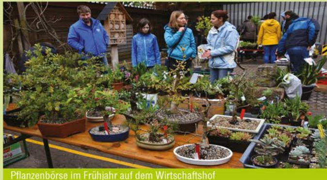
Pflanzenbörse im Frühjahr auf dem Wirtschaftshof

Wer den Botanischen Garten und den Aromagarten unterstützen möchte, kann dies durch seine Mitgliedschaft im Freundeskreis zum Ausdruck bringen. Selbstverständlich sind auch Spenden jederzeit willkommen. Die IBAN für das Spendenkonto finden Sie unten auf der Beitrittserklärung. Bis 100,- € gilt der Kontoauszug als Beleg für das Finanzamt.