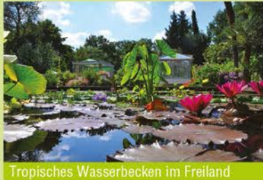
Tropisches Wasserbecken im Freiland

Auch heute bietet er ein breitgefächertes Bildungs- und Informationsangebot auf dem Gebiet des Natur- und Artenschutzes und fördert das Wissen um unsere pflanzliche Umwelt. Besucher schätzen diesen innerstädtischen Ort der Erholung und finden Anregungen zur eigenen Gartengestaltung. Auf einer Fläche von nur 2 ha sind hier