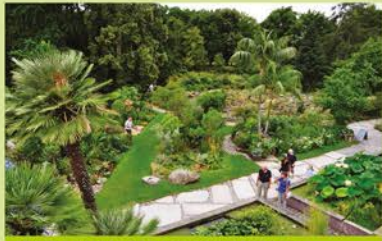
Freiland des Botanischen Gartens

Diese grüne Oase im Herzen Erlangens zieht alltäglich viele Besucher an. Nur wenige Städte besitzen ein derartiges Kleinod in unmittelbarer Nähe der Einkaufsstraßen und kulturellen Einrichtungen. Von der Universität ab 1825 angelegt, diente der Garten früher ausschließlich der Wissenschaft und der universitären Lehre.