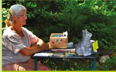
Aufsichtsdienst an der Neischl-Höhle

Sie können sich auch persönlich engagieren, indem Sie die Neischl-Höhle oder Ausstellungen beaufsichtigen, durch Übernahme des Schließdienstes längere Öffnungszeiten ermöglichen, den Freundeskreis-Stand betreuen oder Kuchen