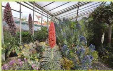
Blick in das Kanarenhaus

ganzjährig bei freiem Eintritt Tausende von Pflanzen aus aller Welt zu finden, geordnet nach systematischen, pflanzengeographischen oder ökologischen Gesichtspunkten. Besonders beliebt bei den Besuchern ist das Palmenhaus mit seinen tropischen Pflanzen, die Sukkulentensammlung, das Kanarenhaus, das Alpinum und