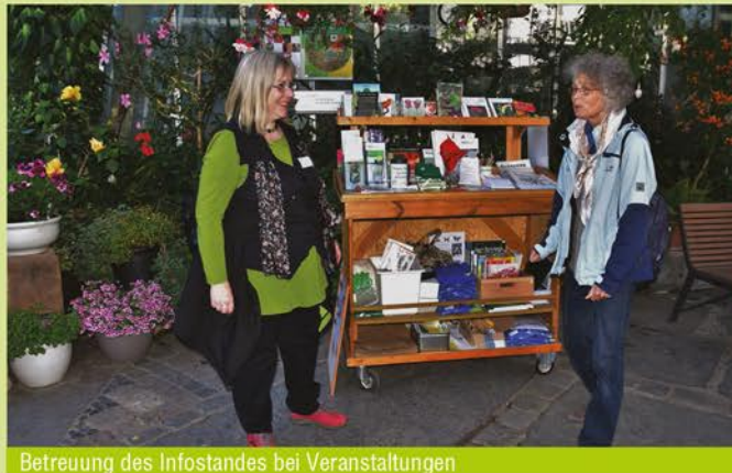
Betreuung des Infostandes bei Veranstaltungen

für Veranstaltungen backen. Das gemeinschaftliche Helfen in einer glücklichen und freundlichen Atmosphäre wird so zu einem echten Spaß. Als Lohn winkt der Kontakt zu vielen interessierten Gartenbesuchern, denen man so eine Freude machen kann.